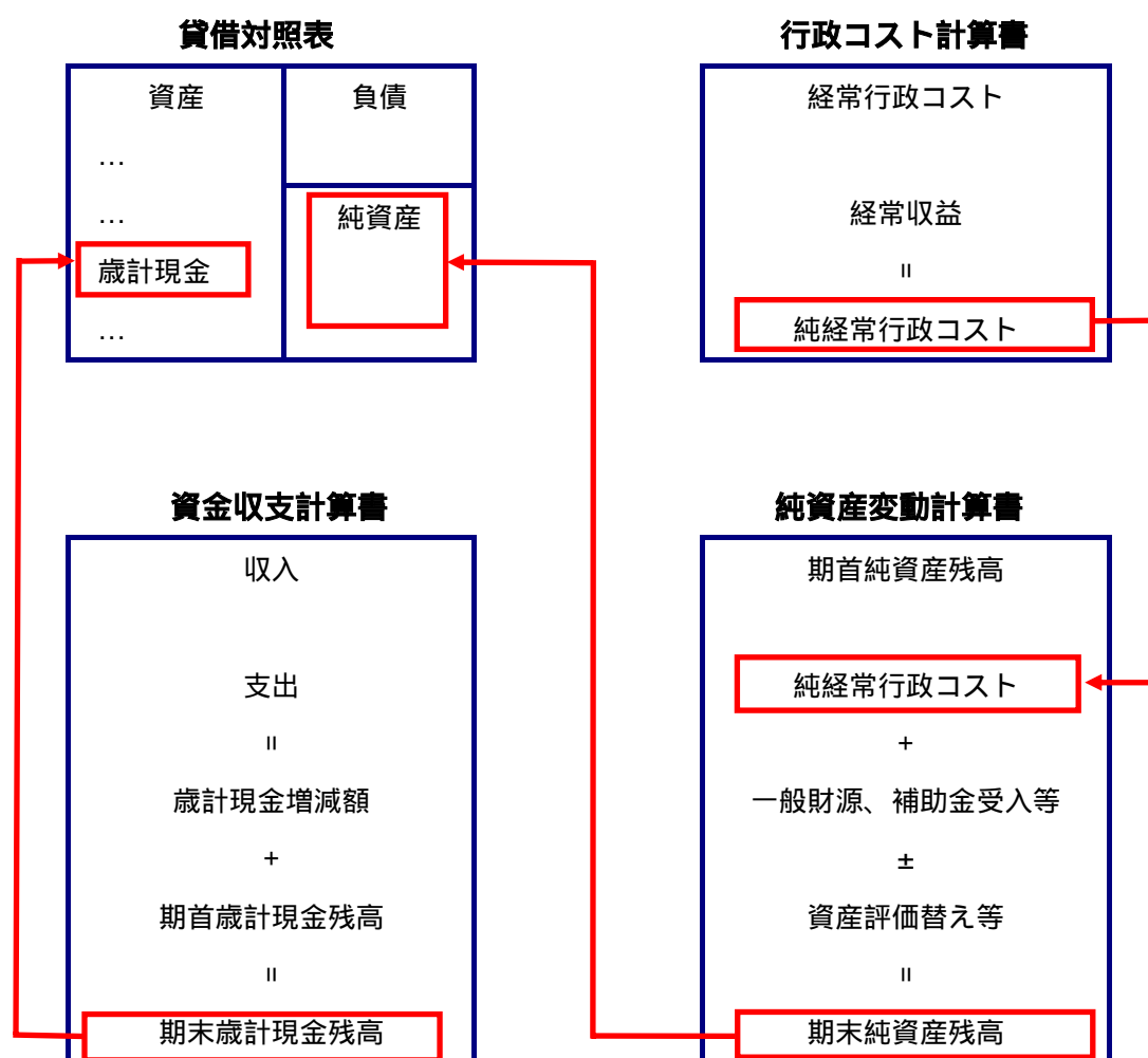
《財務書類 4 表の関係》

これまでの説明のとおり、財務書類は4つの表から構成されていますが、この4表の関係を示したのが次の図です。