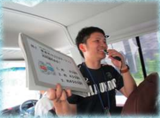
【環境クイズに挑戦】