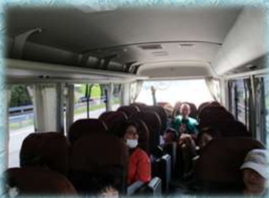
【ゴミクイズは超難問？】