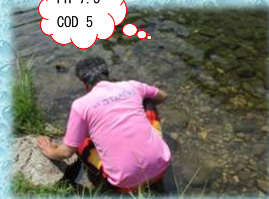
【川の水質も調べました！】