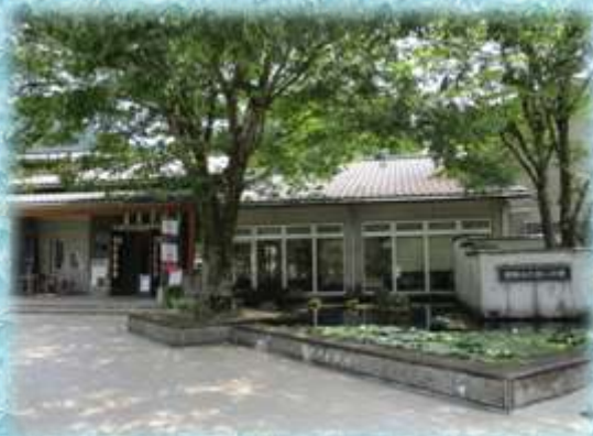
【朝来市ふれあいの家】