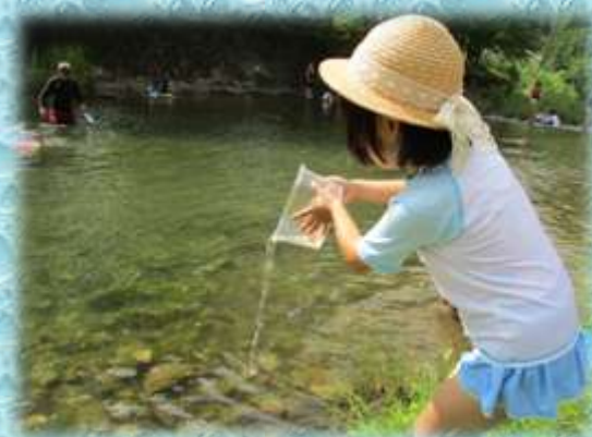
【観察した生き物は全てリリース】