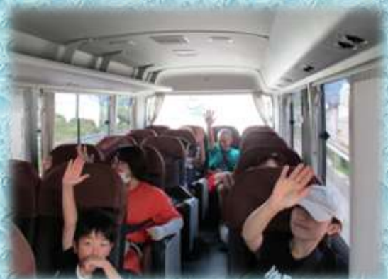
【子供たちもノリノリ!】