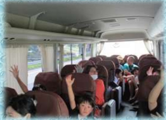
【大人も子供も楽しんで学習】