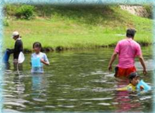
【水中生物観察のはじまり】