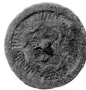
小型仿製鏡 (玉津田中遺跡) (兵庫県立考古博物館蔵)