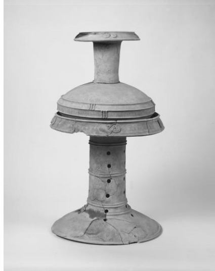
特殊壺・特殊器台(有年原・田中遺跡) (赤穂市教育委員会蔵)