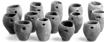
イダコ壺(オボナカムラ) (本館蔵)