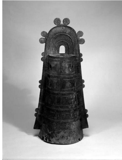
川西市・栄根銅鐸 (東京国立博物館蔵)