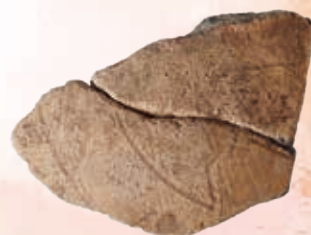
大中遺跡絵画土器（龍部分）