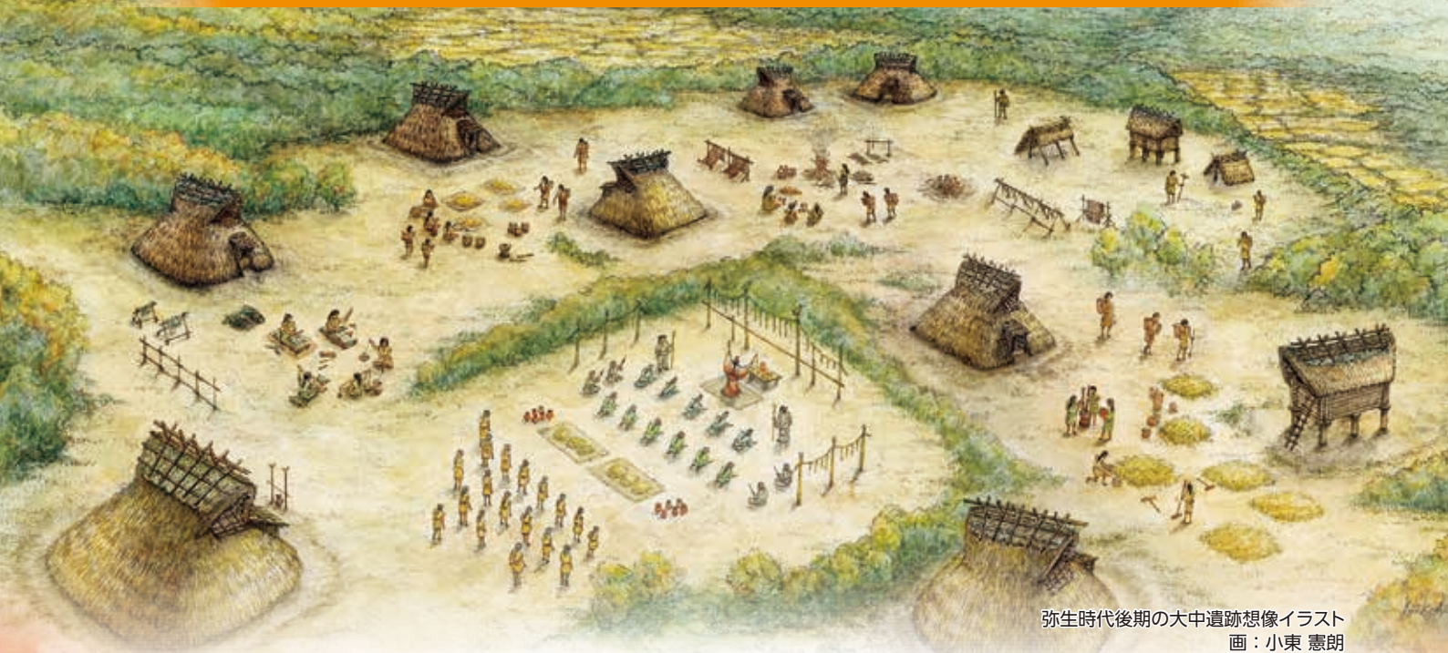
弥生時代後期の大中遺跡想像イラスト 画：小東 憲朗