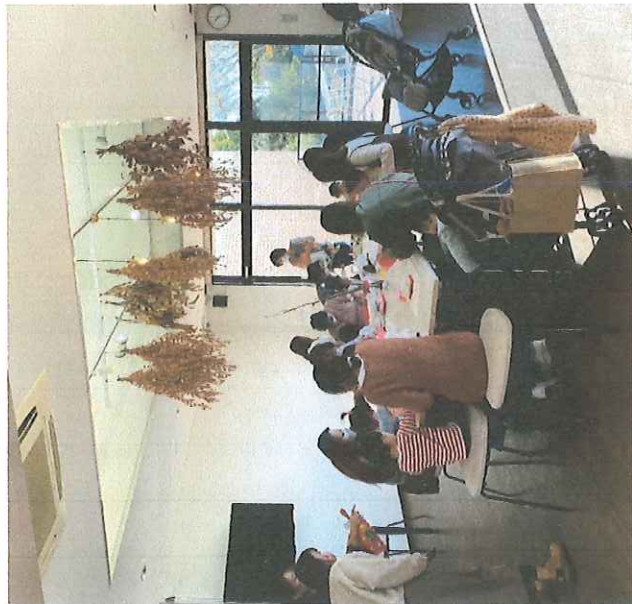
親子クリスマス制作