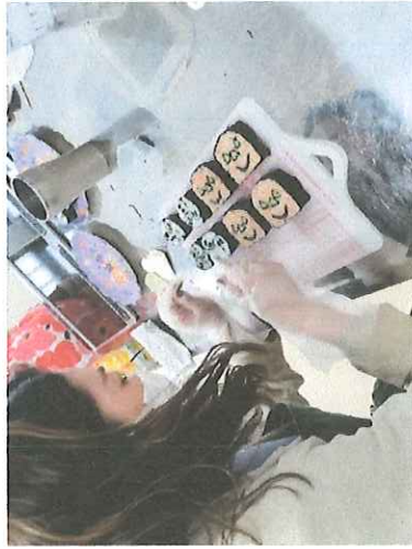
ハロウィン飾り巻き