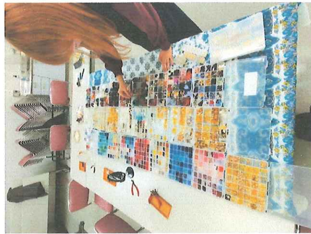
アクセサリー作り