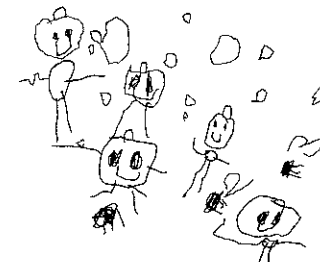
さくらはなびらがふってきたよ(4歳児)