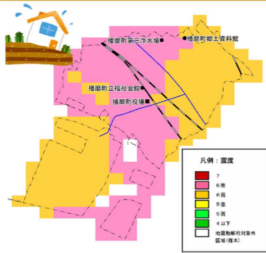
【山崎断層帯地震（大原・土方・安富・主部南東部）による震度分布】

風水害では、播磨町防災マップで想定した加古川などの河川の浸水が町に大きな被害をもたらすと想定されており、町庁舎でも、0.5m未滿の浸水が想定されます。