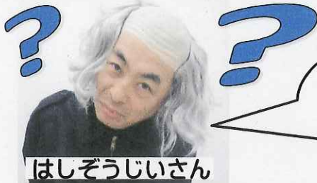
はしぞうじいさん