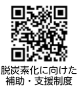
脱炭素化に向けた補助・支援制度