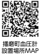
播磨町血圧計設置場所MAP