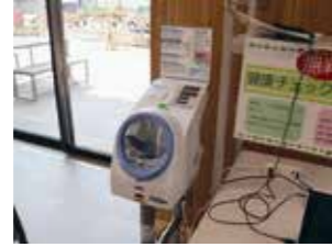
▲東部コミセンに新しく設置された血圧計

自宅に血圧計がなくても、近くの公共施設などで、気軽に測定することができます。また、これまで血圧計のなかった公共施設2カ所に、新たに血圧計を設置します。これにより、町内の施設9カ所で、無料で測定できます。