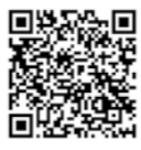
町ホームページはりま健幸のまち宣言

播磨町では体験できない森林でのウォーキングを楽しみませんか？健康づくりや仲間づくりを支援します。詳しい情報は、随時ホームページに公開していきます。