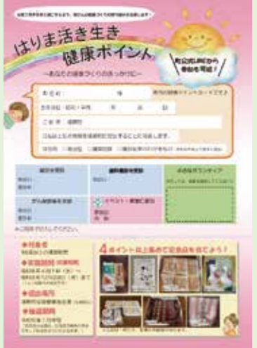
▲活いき健康ポイントの台紙