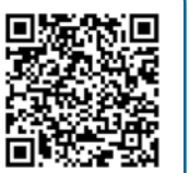
接種券発行 申請システム

▶注意事項 新型コロナワクチンは、インフルエンザ以外のワクチンと同時に接種できず、前後2週間の間隔が必要になります。接種に関する最新の情報はホームページでご確認ください。