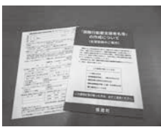
▲登録同意書の返送はお済みですか？

▼配布した人 町内に居住する70歳以上の人、69歳までの身体障害者手帳(1、2級)・療育手帳(A判定)・精神保健福祉手帳(1級)をお持ちの人、要介護3以上の人