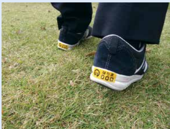
▲事前登録者には、靴や杖などに貼れる反射素材のステッカーをお渡ししています

誰もがなりうる病気…だからこそ、正しい理解が必要 認知症サポーター養成講座を受講して、あなたも認知症サポーターになりませんか?