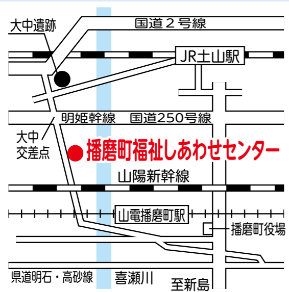
▲地域包括支援センターは、播磨町福祉しあわせセンター内にあります

地域包括支援センターは高齢者やそのご家族の相談窓口です。些細な事でもかまいません。認知症のこと、介護や福祉など何でもご相談ください。専門職が対応いたします。