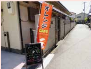
▲オレンジ色ののぼりが目印です