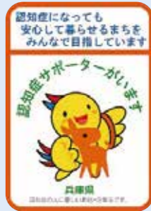
▲ひょうご認知症サポーターステッカー

きれいになったAさんは、翌日、はつらつとコミセンの集まりに出かけることができました。近所のNさんの気転やさしさで、娘さんはどれほど安心されたでしょう。また、Aさんの外出への意欲も保つ事ができました。このように、近所だから、顔見知りだからできる手助けを必要とされている認知症の方や家族がたくさんいます。