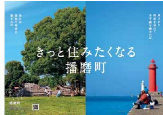
▲播磨町PRポスター第1弾 まちの象徴的な風景をデザインしました。

役場をはじめ、町内各公共施設や県内外のイベントなどで、随時掲示、活用していく予定です。