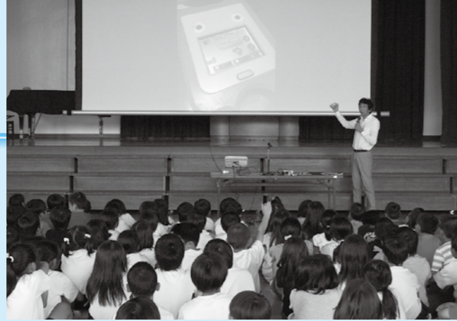
情報モラル講演会 全小中学校でも年1回スマホ・ネット 利用に関する学習会を実施しています

人権デーと人権週間 1948年12月10日、「世界人権宣言」が国連総会で採択されました。国連はこのことを記念し、12月10日を「人権デー」と定めています。国内でも、人権デーを最終日とした1週間を「人権週間」とし、様々な人権啓発活動が全国