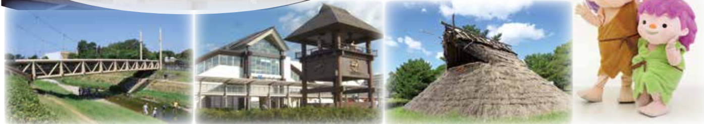
▲喜瀬川とふるさと橋 ▲JR土山駅 ▲国指定史跡「大中遺跡」 ▲いせきくん、やよいちゃん

「播磨町」、「町制55周年」をイメージし、親しみやすい雰囲気のあるロゴマークを募集します。採用作品は、町の印刷物やホームページ及び関連グッズなどに広く利用します。