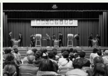
▲東はりま特別支援学校