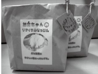
▲食用廃油から作ったせつけん(粉)

加古ちゃんのリサイクルせつけんはいかがですか? 加古郡リサイクルプラザでは、人と自然にやさしい、加古ちゃんのリサイクルせつけんの製造販売を始めました