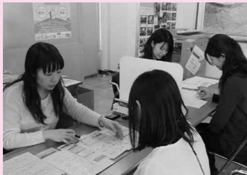
▲申請書の記入方法、必要書類の代理投函ほか、個人番号カード交付申請についてお手伝いしています