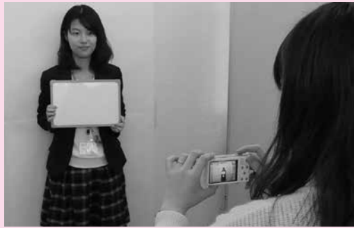
▲申請に必要な写真撮影（無料）