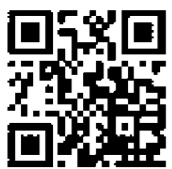
防災安心ネットはりまQRコード

●登録すると次の情報が受けられます ・播磨町からの災害時の情報や地域の不審者情報などの緊急情報 ・「ひょうご防災ネット」を通じて気象情報、地震情報など ・避難所一覧 ・休日の救急当直医情報