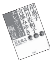
●エレガンスの極意 五木寛之 聞き手(扶桑社)