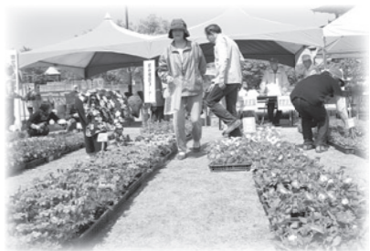
▲緑化イベント (P2参照)