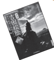
●図説吉田松陰 木村幸比古 著(河出書房新社)