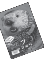
●ラッコのひみつ 池田業津美文(新日本出版社)