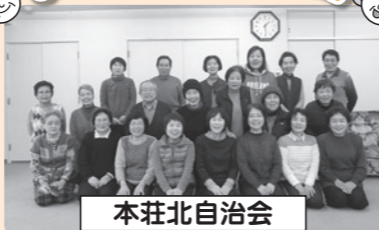
本荘北自治会 地域でいきいき100歳体操

「われらいきいき仲間」 いきいき100歳体操で元 気アップ!に取り組み ステキな皆さんを紹 介します。