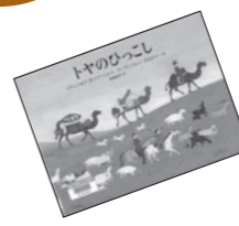
●トヤのひっこし イチノロブ・ガンパートル文(福音館書店)