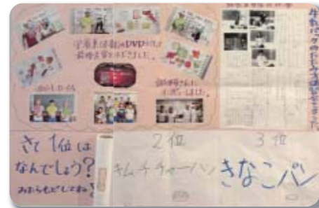
▲人気メニューの1位はカレーだそうです

また、期間中、ロビーでは各学校における食育活動の様子や学校給食の歴史年表などが展示され、皆さん興味深く見入っておられました。