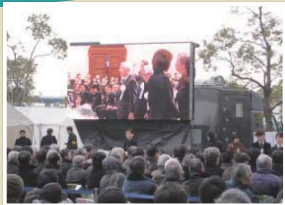
▲県公館での追悼記念式典がハット神戸の式典会場でも映し出されました

立春も過ぎ、心なしか陽射しも明るくなってきました。もうすぐ春ですね。この間まで飾っていた折り紙の「節分鬼」に代わって「おひなさま」を届けていただきました。町長室の一角がほっこりと華やいています。日本に伝わる四季折々の行事を大切にしたいですね。