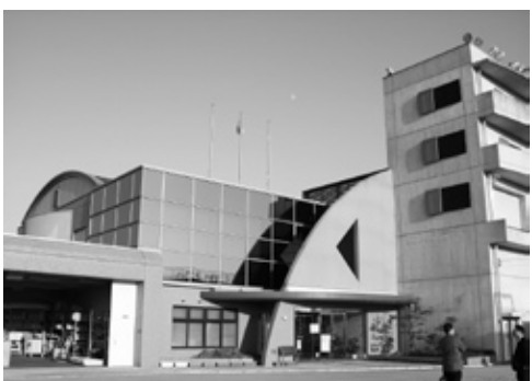
▲加古川市防災センター

加古川市防災センター 上級救命講習会 固定や止血などの応急手当、搬送法、AEDを使用した心肺蘇生法の講習会です。 ▼日時 10月25日(出) 午前9時～午後5時 ▼場所 加古川市防災センター ▼対象 播磨町、稲美町、加古川市に在住または在勤の人 ▼定員 先着30人 ▼費用 無料 ▼申込み・問合せ 10月9日(休)午前9時から、電話で受け付けます 加古川市防災センター 079(423)0119 ※月曜日、14日(火)、19日(日)は受け付けできません。