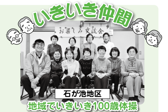
石が池地区 地域でいきいき100歳体操

石が池地区の皆さんは、毎週木曜日の午後1時30分から2時30分まで、自治会集会所で元氣アップ中です。きっかけは、「身近な場所で、みんなで運動を続けたいな」と考えた方が、かわいい絵入りの案内で、ご近所さんをお誘いしました。それから1年以上続いています。写真は、昨年12月に開かれた自治会の交流会でメンバーの指導で体操した時の様子です。参加者も重錘バンドを付