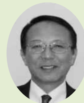
『空気の教育をもとめて』