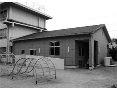
▲播磨小学校学童保育所

匿名希望さんより 「倅」 子どもに恵まれ感謝。子どもと共に親となり、成長していく喜び。感謝と喜びで倅せを感じる。