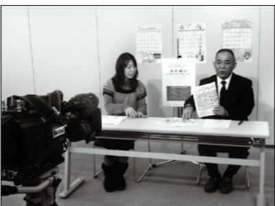
▲播磨町人権啓発カレンダー「ふれあい」を紹介します(1月5日~14日放送)

カラ期間がないために25年の資格期間を満たせない方は、60歳から70歳になるまでの間に、国民年金の任意加入者になることもできます。この場合の保険料の額は、一般の第一号被保険者と同様、平成23年度は月額1万5020円となっています。ただし、任意加入者には免除制度がありませんので、ご注意ください。任意加入についても、保険年金グループまたは加古川年金事務所にご相談ください。