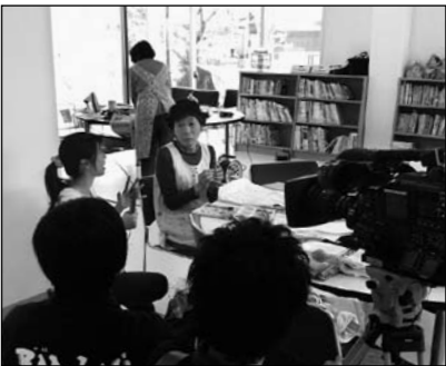
▲染め物教室を紹介しています(7月31日まで放送)