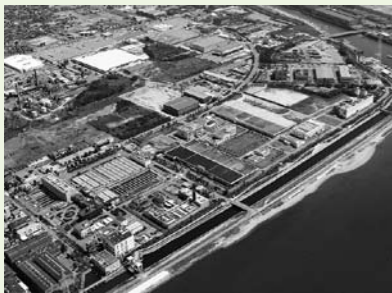
▲加古川下流浄化センター

▶所要時間 2時間程度 ▶参加費 無料 ▶定員 先着100人 ▶申込み・問合せ 8月19日(金)までに電話またはFAXで住所、氏名、年齢、連絡先をお知らせのうえお申し込みください 加古川下流浄化センター ☎079(424)1313 FAX079(424)1314