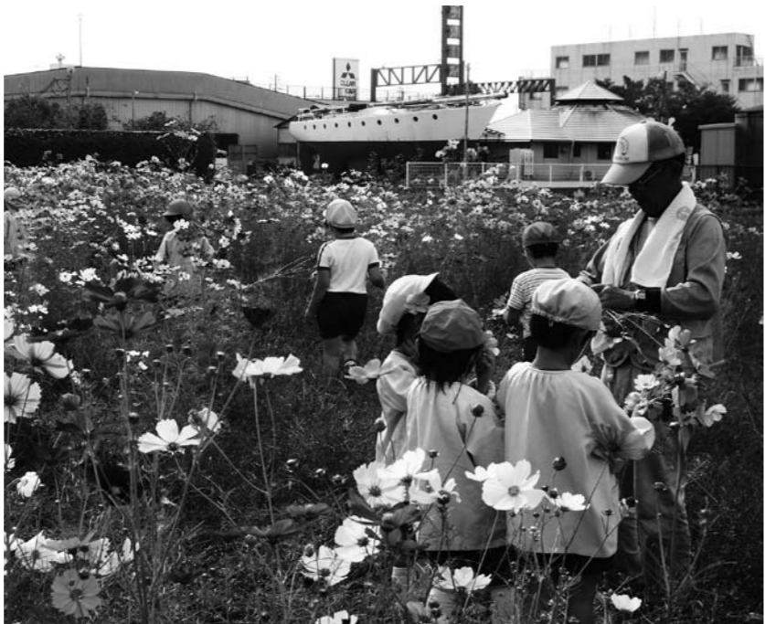
▲不耕作地を有効活用します

の良さが光ります。ネットワークの源は、「人」です。「おもしろそうやね!」その一言で新しい仲間と出会えます。人と人が出会い思いを伝え合いわかり合いながら広がっていきます。人とのつながりが希薄な時代に出会った感動を大切にしながら...。皆さんとの出会いを楽しみにしています。