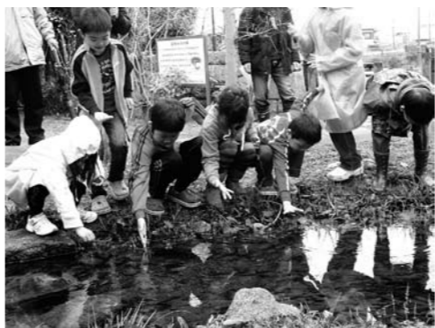
◀ピオトープを通じてエコアップ

当塾は、人と人とのつながりを大切に行っています。難しい解釈や理屈をぬきにして人とのふれあいを楽しみながらエコアップから魅力あるまちづくりに取り組み、次世代に誇れる何かを残す為にあなたと一緒に活動しませんか。