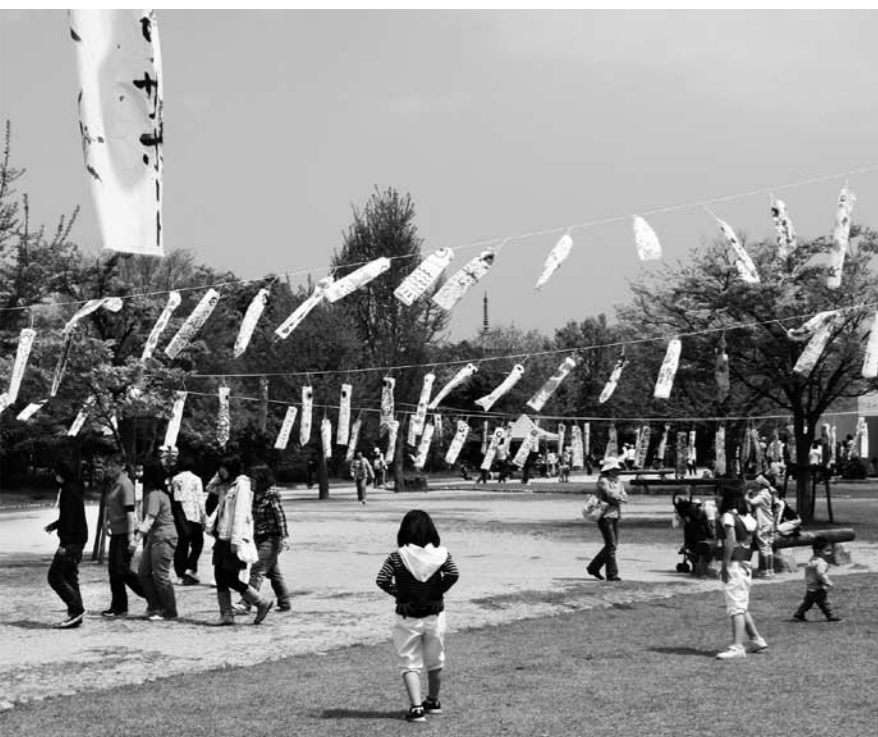
▲地域の人とかかわりながら子どもたちを育てます