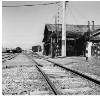
▲廃線でなくなった別府鉄道