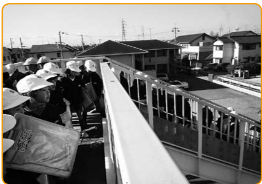
▲上から見てみると…