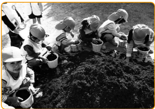
▲土はふわっとかぶせてね