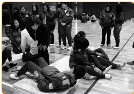
▲妊婦服を着て起き上がる体験をしました