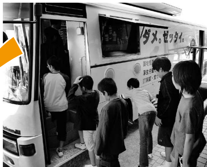
キャラバンカーが学校などにやってきます