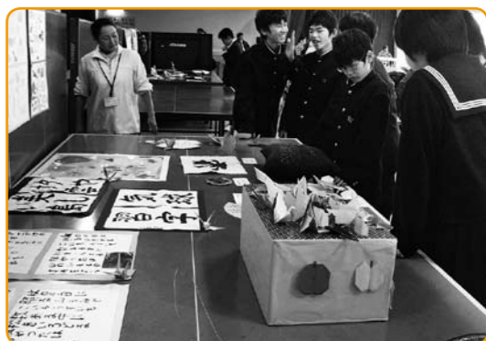
▲みんな上手だなあ