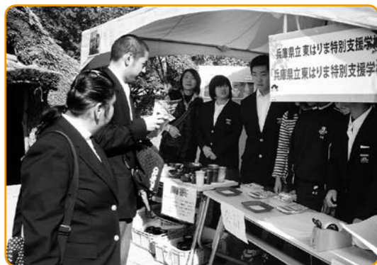
▲生徒が作ったものを販売しました