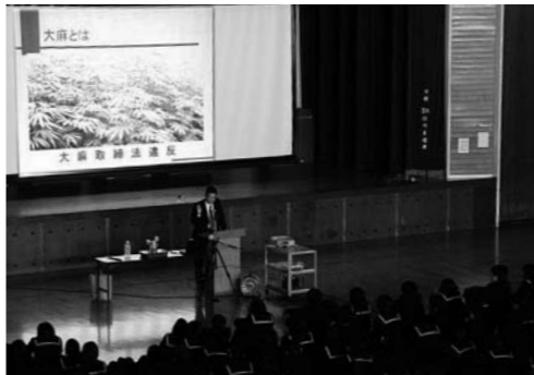
薬物の話を聞いて学びます