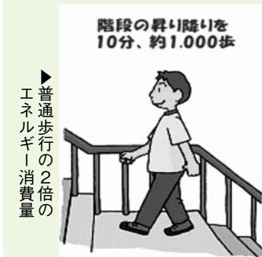
▶普通歩行の2倍のエネルギー消費量

「摂取カロリー」よりも「消費カロリー」を増やすためには、まずは、この「二一ト」の量を積極的に増やすこと、そして何よりも「意識した運動量」を増やすことに取り組んでいく必要があります。