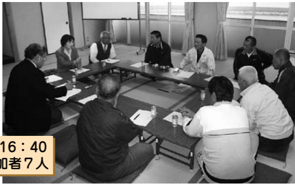
4月16日(金) 15:30~16:40 播磨町漁業協同組合 参加者7人

Q 浜手は昔のままのように思えるが A 昨年には新島球場のトイレ・駐車場整備などを行った Q 古宮についてはどうか A ダイワボウの社宅跡地に170軒ほどの宅地が分譲される。それに伴う周辺の整備も行っていく。浜幹線事業も積極的に用地買収を進めている。また地区内の水路整備も実施する