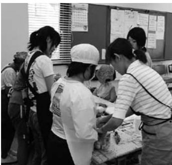
▲おやつづくりの様子