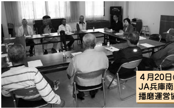
4月20日(火) 16:00~17:10 JA兵庫南ふぁ～みんSHOP 播磨運営協議会 参加者12人

Q 播磨町の農業を活性化するにはどうすればよいと思うか A ある企業が商工会の前で販売しているが、企業が農業に関わるのも一つの方策だと思う