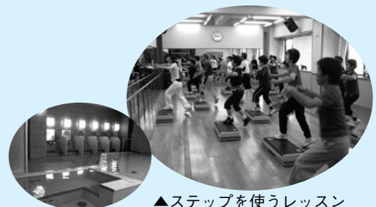
▲ステップを使うレッスン

新年度です!心新たに運動を始めませんか!健康づくりのため、新年度より運動を始めようと思われる方はぜひ当センターでの運動をお勧めします。当センターには次のような施設があります。