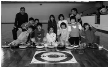
▲子どもいきいきカローリング教室