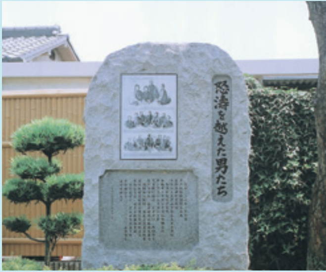
▲今、私たちに語りかけてくる

今月は古田の正願寺にある「永力丸漂流百五十年記念碑」を紹介いたします。ここには、1850年、永力丸に乗っていて漂流したジョセフ・ヒコを含め、17人の乗組員が、当時のアメリカの新聞に描かれた姿を、碑に刻んでいます。