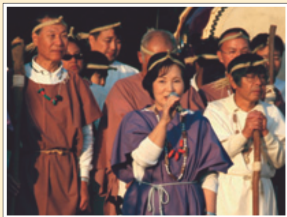
▲大中遺跡まつりにて

見事に紅葉した木の葉が、舞い落ちる季節となりました。さわやかな秋日和、町内では多くの行事や大会が開催されました。