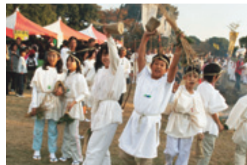
▲いつの時代も元気がいちばん