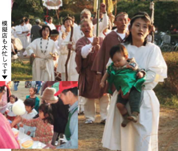
▲ムラ人の長い列がパレードしました