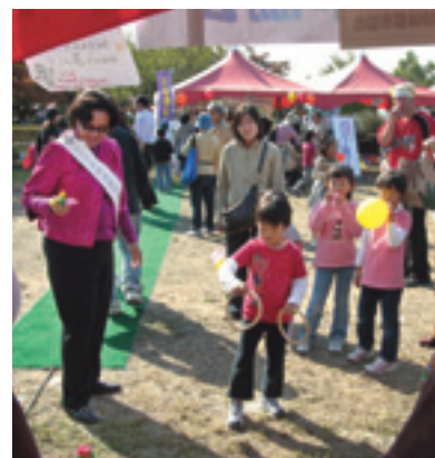
▲楽しいクロリティ

11月1日(木)から5日(月)の5日間、姉妹都市アメリカ・ライマ市から、ライマ姉妹都市協会の訪問団7人が来訪され、5つの家庭に分かれてホームステイをするなど交流を深めました。2日、訪問団は播磨南中学校で文化祭を参観し、生徒からインタビュアーを受けるなど楽しいひと時を過ごした後、加古郡リサイクルプラザで紙すきを体験。役場を訪問後、夜には播磨町国際交流協会主催の歓迎会に出席して、100人を超える参加者と交流しました。翌日は大中遺跡まつりへ。ライマプースで子どもたちとクイズやクロリティを一緒に楽しんだり、貫頭衣を着て古代パレードに参加しました。