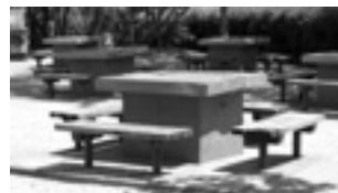
▲ぜひ、ご活用ください