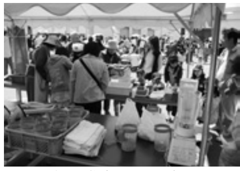
▲紙すき体験コーナーも楽しい

▼日時 11月18日(日) 午前9時30分～午後2時30分 ※小雨決行・雨天中止(順延なし)