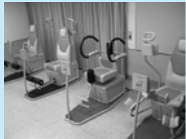
▲低体力者用のトレーニングマシン4台