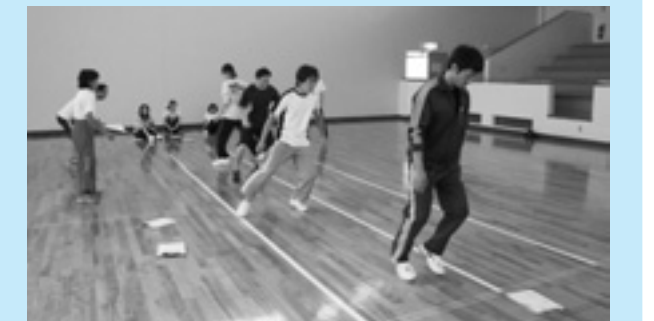
▲何回跳べたでしょう

当クラブでは今後も継続して体力テストを行う予定ですが、テストは一般の方も参加できますので、「最近、体力が衰えたかな…」と思われる方、一度テストを受けてご自身の体力を確かめてみてはいかがでしょうか。日程など詳しくはスポーツクラブ21はりままでお問い合わせください。