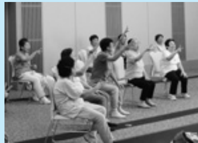
▲いすを使った運動

▼申し込み 11月30日(金)までに参加費を添えてセンターまでお申し込みください。