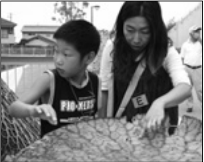
▲写っている方に画像データを差しあげます。企画グループへお電話を。