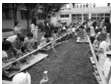
▲大ウケ、校舎2階からのそうめん流し

■親子キャンプ 蓮池小学校にて、7月21日(土)から22日(日)に実施。84人の参加がありました。