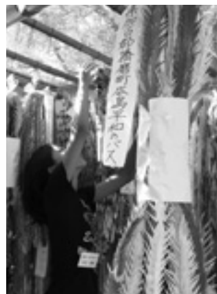
▲平和を折って千羽鶴を捧げます

家族で考えた 広島平和のバス 1日目は、宮島で昼食、厳島神社を見学した後、平和記念公園に移動、音声ガイドを聞きながら、平和記念資料館を見学しました。展示物について、親子で話し合う姿が印象的でした。 2日目は、原爆ドームを見学し、平和を願って住民の方と参加者が折った千羽鶴を原爆の子の像に捧げました。その後、資料館で原爆記録映画を鑑賞