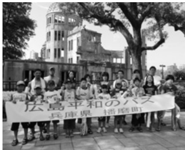
▲原爆ドームの前で

家族で考えた 広島平和のバス 1日目は、宮島で昼食、厳島神社を見学した後、平和記念公園に移動、音声ガイドを聞きながら、平和記念資料館を見学しました。展示物について、親子で話し合う姿が印象的でした。 2日目は、原爆ドームを見学し、平和を願って住民の方と参加者が折った千羽鶴を原爆の子の像に捧げました。その後、資料館で原爆記録映画を鑑賞