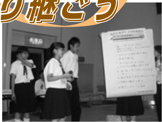
▲播磨町の平和宣言文を発表

終戦から62年が経過しました。時が経つにつれ、戦争の悲惨さや核兵器の恐ろしさを体験した世代の人が少なくなっています。 播磨町では昭和57年に「核兵器廃絶のまち宣言」を行い、今年も8月8日(水)～10日(金)に長崎へ「播磨町平和特使」を派遣し、8月19日(日)～20日(月)には「広島平和のバス」を実施しました。8月1日(水)には「平和祈念講話会」も開催し、家族や友達と平和の大切さを考える機会となりました。