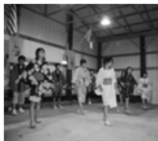
▲ソーラン節を披露

20日(月)は、全員でライマ市内の市庁舎などを訪問し、翌日には、オハイオ州の州都であるコロンバス市に行きました。コロンバス市ではオハイオ大学のアメリカンフットボールのスタジアムやオハイオ州の議事堂などを見学し、一緒に参加されたライマ市の方とも会話が弾みました。