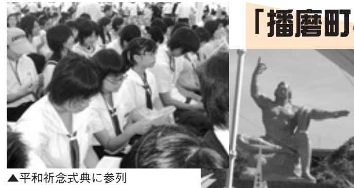
▲平和祈念式典に参列

町立の両中学校からそれぞれ2人が、長崎で開催されたフォーラムに参加し、全国から集まった生徒たちと平和について話し合い、独自の平和宣言文を作成して発表しました。また、8月9日(木)には、平和祈念式典にも参列し、平和への思いを新たにしました。