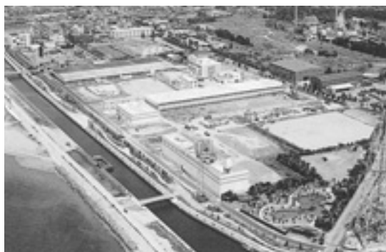
▲加古川下流浄化センター

「役場の方から来た」と語り、ご家庭を訪問して水道管や下水道管を点検・清掃する業者が増えてきました。「無償で点検します」と言って点検し、わずかな不良箇所を見つけて強引に修理を迫るという手口で多額の料金を請求するトラブルが各地で発生しています。町では、業者にそのような指示を出していませんのでご注意ください。