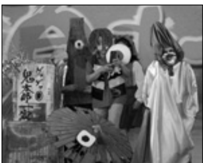
▲写っている方に画像データを差しあげます。企画グループへお電話を。