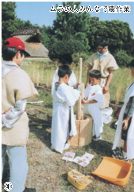
ムラの人みんなで農作業