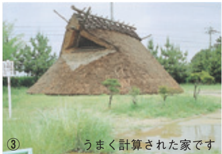
うまく計算された家です