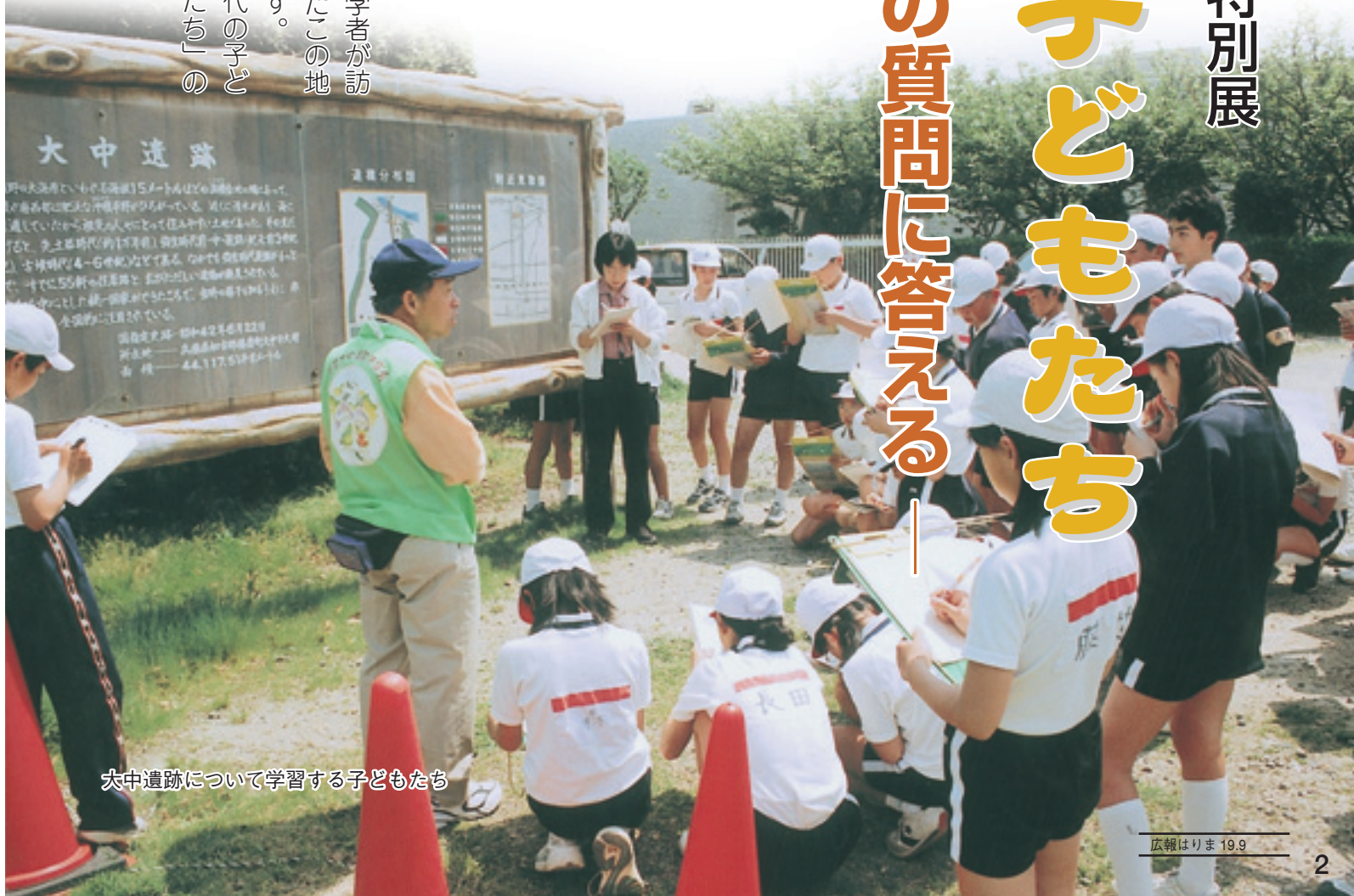
大中遺跡について学習する子どもたち

播磨町の誇り、国指定史跡『播磨大中遺跡』には、毎年多くの見学者が訪れます。学習の一環で訪れた子どもたちからは、遥かなる時を越えたこの地の暮らしを知りたいという好奇心に満ちた多くの質問が寄せられます。大中遺跡発見から45年目を迎える記念特別展では、そんな「現代の子どもたち」からの代表的な51の質問に対する、「弥生時代の子どもたち」の答えをご紹介します。