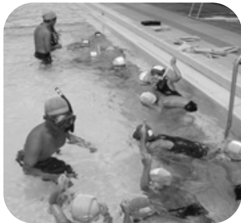
▲ぶくぶくシュノーケリング教室

住所 播磨町本荘70番地1 播磨町総合体育館内 ☎079(437)2201 ☎079(437)3382 e-mail harima21@arion.ocn.ne.jp ホームページ http://www8.ocn.ne.jp/~sports21/