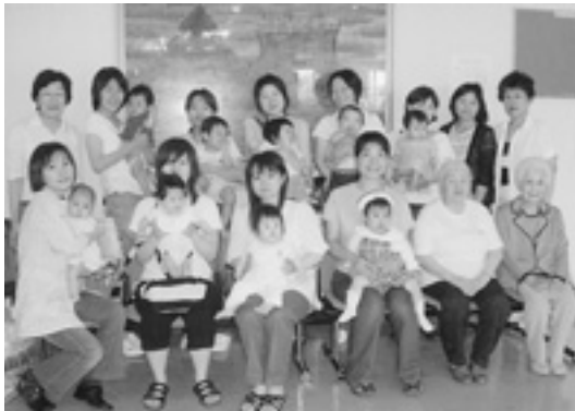
▲12組の親子が集まっています

▶採用予定人員 2人 ▶資格 ▷短大・高専・専門学校卒 昭和60年4月2日以降に生まれた人 ▷高校卒 昭和62年4月2日以降に生まれた人 ▶受付期間 8月16日(木)～23日(木) 午前9時～午後5時(土・日曜日は除く) ▶1次試験日 9月16日(日) 教養・体力 9月17日(祝) 集団面接 ▶問い合わせ 募集要項は町役場案内、加古川市役所案内、各消防署・分署などにあります 加古川市消防本部 総務課 ☎079(427)6528