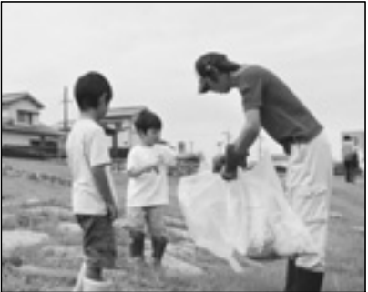
▲写っている方に画像データを差しあげます。企画グループへお電話を。