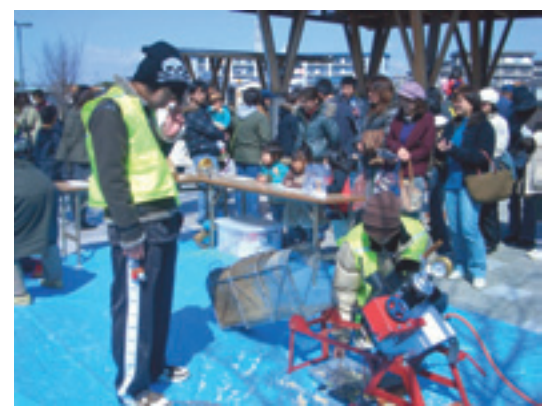
▲各コーナーに列ができるほど大盛況でした

平成18年度は3つのゆめづくり塾が独自の活動を行ってききましたが、活動の総仕上げとして、合同のイベントを3月17日に開催しました。