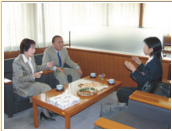
▲青年海外協力隊のお話を伺いました

☆風薫るさわやかな季節となりました。町内の学校・園でも多くの子もたちが入学式を迎えました。おめでとうございます。子どもたちが安全で楽しい学校・園生活が送れるよう、サポート体制をさらに充実させていきたいと思っています。