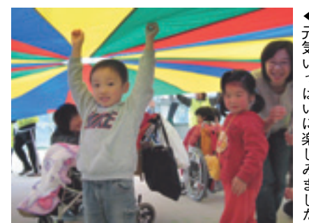
▲元気いっぱい楽しめました

3月24日(土)にははりまシーサイドドームで催された障害者スポーツ大会は、今年で第2回目の開催となりました。 NPO法人スポーツクラブ21はりま、NPO法人文化・福祉・人権サポートアエソン、播磨南高等学校など多くのボランティアが、趣向を凝らしたスポーツやゲーム約10種類を準備し、参加者は高得点を狙って次々と各コーナーを回っていました。