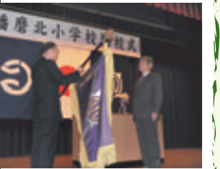
▲校旗が返されました