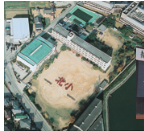
「ありがとう さようなら北小2006」 全校児童によるの文字

播磨北小学校は昭和56年4月1日に、4校目の町立小学校として開校しました。これまで、26年間で通った児童は1720人余りでした。3月25日(日)の閉校式には、歴代の校長先生や卒業生も駆けつけて、壇上の校旗や校舎を見つめていました。 また、在校生たちは3月23日(金)に修了式に引き続き閉校式を行い、慣れ親しんだ北小学校に大きな声で「さようなら、ありがとう」と、お別れを告げて、校歌を斉唱しました。 児童たちは4月から、蓮池小学校、播磨西小学校、播磨小学校に転校します。播磨北小学校跡地の利用については今後引き続き協議が進められます。