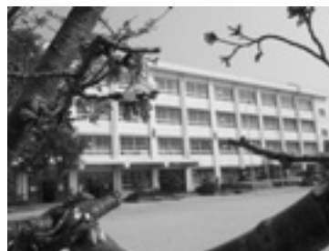
▲播磨北小学校 (3月22日撮影)

議会応募」とお書きください。Eメールの場合は、件名を「播磨北小学校跡施設運営協議会応募」としてください。