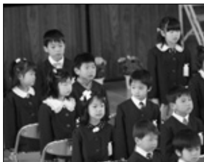
▲写っている方に画像データを差しあげます。企画グループへお電話を。

また、町勢発展はもとより、町民の皆様への心もったよりよいサービスを提供できるよう、職員一丸となり努力したいと思っております。もとより微力ではございますが、全力を傾注し職務に精励いたす所存でございますが、全住民の皆様方の一層のご支援とご協力をお願い申し上げます。就任のごあいさつといたします。