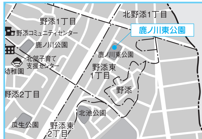
③鹿ノ川東公園 4月12日(木) 午後2時～2時20分