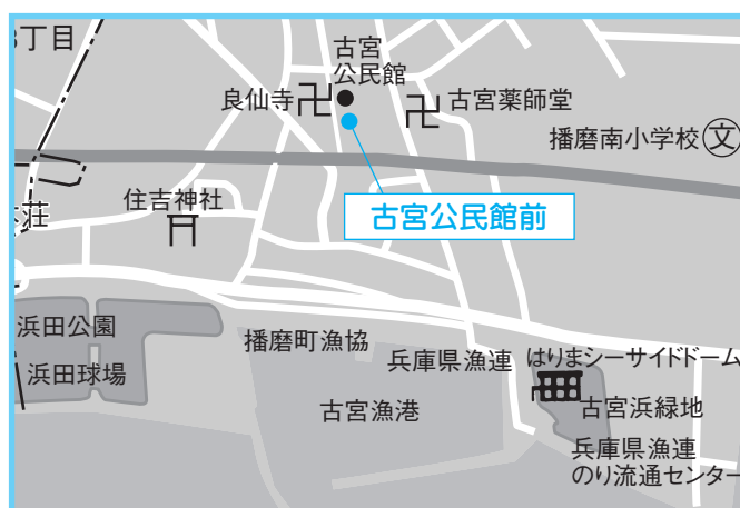
⑥古宮公民館 4月13日(金) 午後1時30分～1時50分