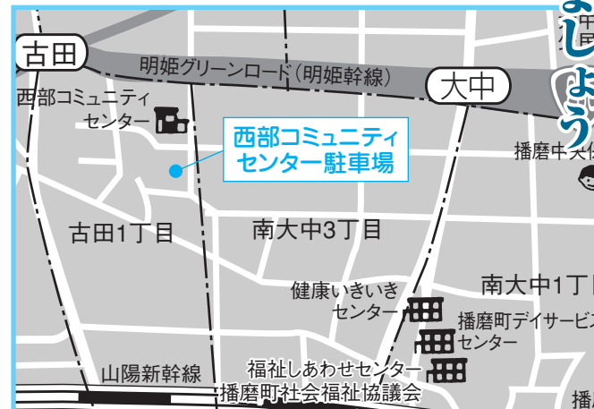
①西部コミセン 4月12日(木) 午後1時～1時20分