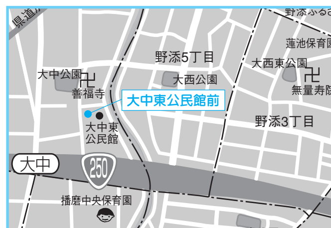
②大中東公民館 4月12日(木) 午後1時30分～1時50分