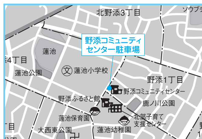
④野添コミセン 4月12日(木) 午後2時30分～3時