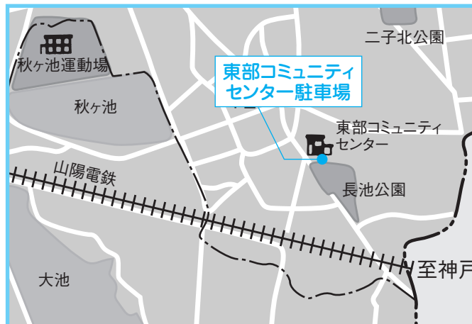
⑤東部コミセン 4月13日(金) 午後1時～1時20分