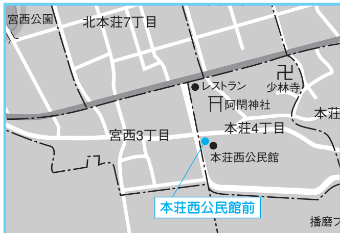
⑦本荘西公民館 4月13日(金) 午後2時～2時20分

動物病院では、日常の健康管理なども含め、予防接種以外のアドバイスもします。集合注射以外での接種を希望される方は、動物病院に直接お越しください。 ▼問い合わせ 表2の各動物病院