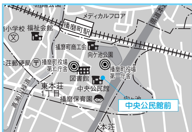
⑧中央公民館 4月13日(金) 午後2時30分～3時