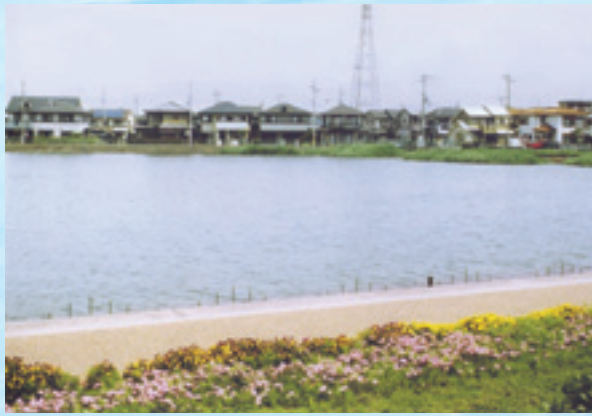
▲春の日差しの中池

日差しはすっかり春。太陽に誘われるかのように植物の芽がふくらんでいます。池の水も温かくなり、水辺ではさざ波がたつくる輝きの中で、生き物が動き始めています。多くの魚が泳ぎ、カエルや亀なども日差しを楽しむかのように水辺に顔を出します。さらによく見ると、ミススマシやアメンボウも、水面に小さな波紋をつくりながら、エサを求めています。ため池は、いろいろな生き物を育てています。私たちにとっても大切な水は、小さな生き物にとっても大切です。今一度、春の日差しの下、水辺を歩きながら、水の大切さを考えたいですね。