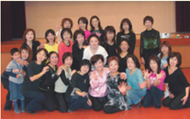
▲元気なお母さんが播磨町にはたくさんいます