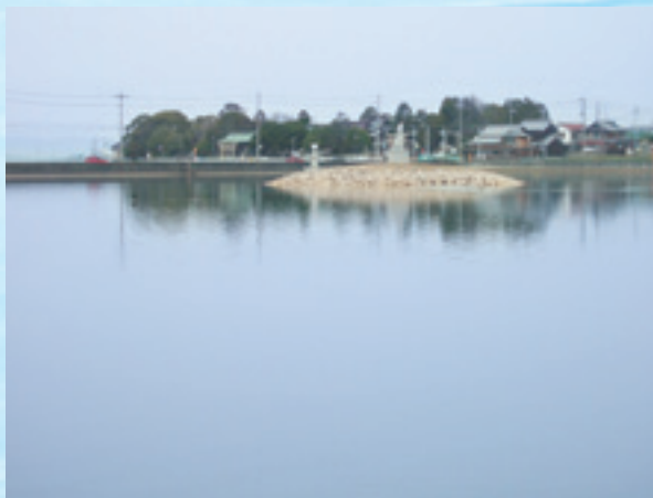
▲天満大池(稲美町)は憩いの水辺でもあります

県内最古のため池は、稲美町の天満大池で、伝承によりますが675年に造られました。