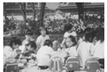
▲チューリップ大好き