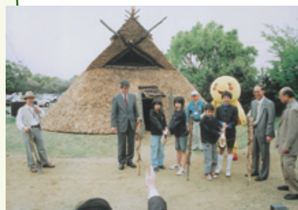
▲いろいろな形の住居が並びました

中遺跡のムラのイメージを広げていきます。これで、四季折々が楽しめる大中遺跡の魅力がさらにすばらしいものになりました。これからも、季節の移ろいとともに変わる大中遺跡の風景をぜひ見に来ていただければと思います。