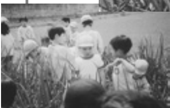
◀こんなに大きくなって