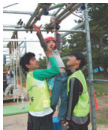
▼サスケコーナー テレビでみたクリフハンガーやそりたつ壁に挑戦する子どもたち。みんな真剣。