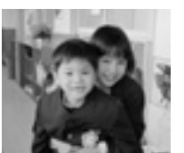
▲なかよくしようね