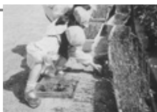
▶ダンゴムシさん、やっぱりここにいたのね

「おかあさん!」と泣いてお母さんから離れられなかった3歳の子もたちが、お兄ちゃんやお姉ちゃんたちが楽しそうに遊んでいる様子を見て、「おもしろそうだな!」「やってみよう!」と、したいことが見つかり始めています。さあ、今日は何をしようかな!