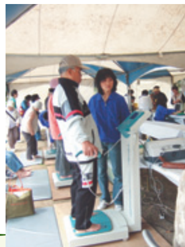
▼健康コーナー 気軽に健康チェックができるいい機会です。多くの人が体成分測定や血管年齢測定などに立ち寄り、アドバイスをもらいました。