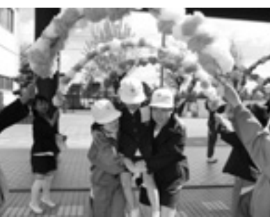
▲とってもうれしい

南っ子（たてわりグループ）のお兄さんお姉さんのおみこしに乗って、花のアーチをくぐって1年生の入場です。どの顔もとっても嬉しそうです。いよいよ「1年生を迎える会」の始まりです。