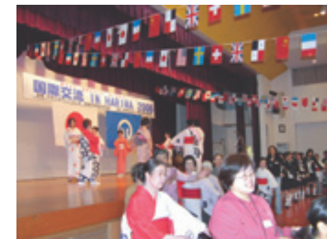
▲盆おどりをみんなで踊りました

中遺跡のムラのイメージを広げていきます。これで、四季折々が楽しめる大中遺跡の魅力がさらにすばらしいものになりました。これからも、季節の移ろいとともに変わる大中遺跡の風景をぜひ見に来ていただければと思います。