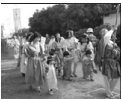
▲写っている方に画像データを差しあげます。企画グループまで。

▼目的 神戸製鋼所加古川製鉄所の環境データおよび環境・防災などの情報を公開する ▼設置場所 播磨町役場第一庁舎（会計グループ横掲示板前） ▼公開データ 窒素酸化物および硫黄酸化物の排出データ（時間値） 降下ばいじんデータ（月間値） なお、窒素酸化物および硫黄酸化物については、加古川市および兵庫県の公害防止協定に基づく協定値も合わせて記載されています。 ▼設置主体 神戸製鋼所加古川製鉄所 ▼問い合わせ 神戸製鋼所 環境フリーダイヤル ☎0120 (14) 5065