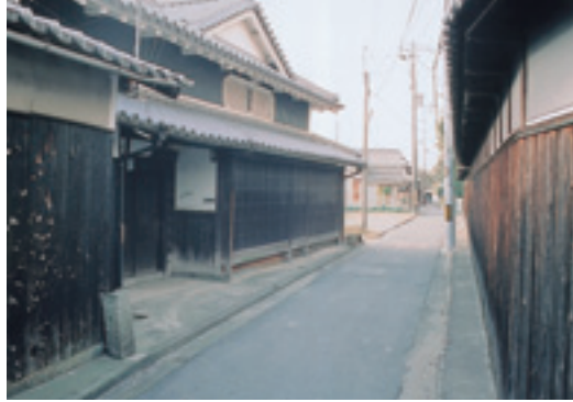
▲懐かしいたづまいが残っています

二子東の交差点を南西に入ると、京都の町屋を思い出させるような、古い町並が町内にもまだ残っていることに気が付きます。