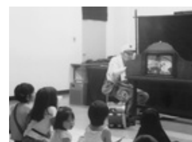
▲だっせのおっちゃんの紙芝居