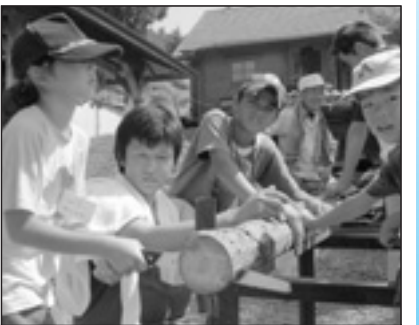
▲写っている方に写真または画像データを差しあげます。企画調整課まで。