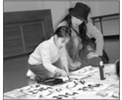
▲写っている方に写真または画像データを差しあげます。企画調整課まで。